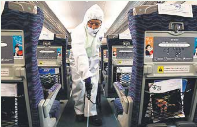
Дезинфекцията в Китай