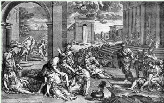
Бубонната чума погубва половината население на Европа

• Контактите. Преди години в. „Лечител“ по повод сезонния грип посъветва читателите: „ Не се ръкувайте, не се