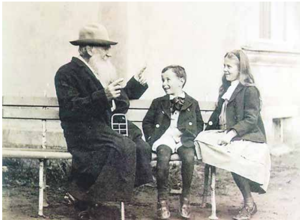
Лев Толстой с внучките Соня и Иля

Това вече подсказва, че го е споходил здравият разум: „Моята кариера е литературата! Да пиша! Да пиша! От утре до края на живота си или ще работя, или ще зарежа всичко: правила, религия, благоприличие, всичко!“ (10 октомври 1855 г.)