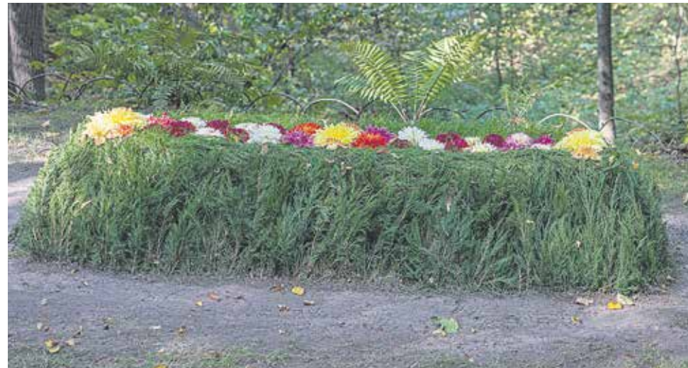
Гробът на Лев Толстой

„Разхождайте се всеки ден, без значение по кое време! Всички лекари го препоръчват... Но това са само дребни неща. Главното е, когато отивате да си легнете,