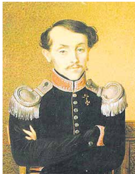
Бащата на Лев Толстой – граф Николай Толстой

Баща му граф Николай Илич Толстой има някакви сериозни, ала неуточнени проблеми със здравето (той пуши лула) –