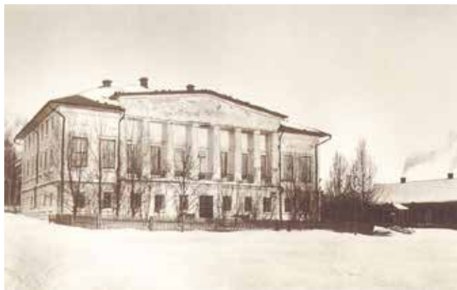
Родният дом на Л. Н. Толстой, 1828 г.

Явно тестваностеронът е повече и по-мощен от разума, от волята, от добродете-