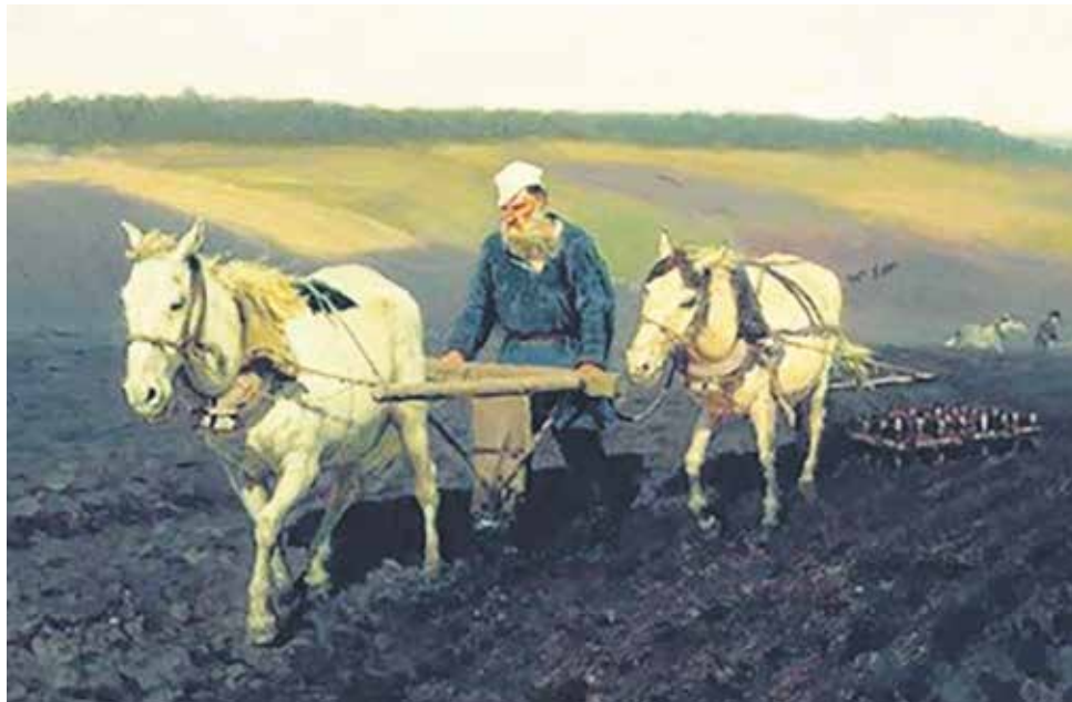
Картина на Репин, в която художникът изобразява как Толстой оре

Февруари 1852 г. преминава в походи и престрелки с местните планинци. На 5 февруари младият ефрейтор отбелязва в своя „Дневник“: „Безразличен съм към живота: дал ми е прекалено малко радости, за да го обичам. Следователно, не ме е страх и от смъртта. Не се боя също и от страданието. Но ме е страх, че няма да посрещна достойно страданието и смъртта“.