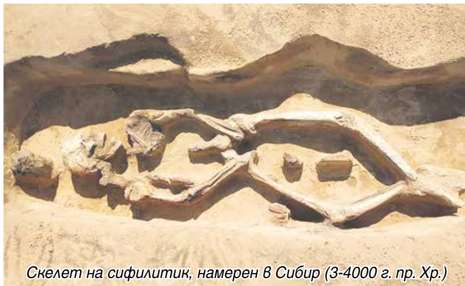
Скелет на сифилитик, намерен в Сибир (3-4000 г. пр. Хр.)

Подобна прибързаност явно е отчетена като грешка, защото впоследствие Ватиканът решава, че стигматици могат да се канонизират за светци едва 100 години след смъртта им. А друг папа се произнася, че със стигмите следва да се занимават психиатрите, а не свещениците.