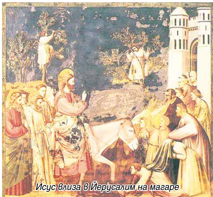
Исус влиза в Йерусалим на магаре

„беловлас старец“ (като Бетовен, Ленин, Шопенхауер, Ленау, Мане и много други, все доказани сифилитици).