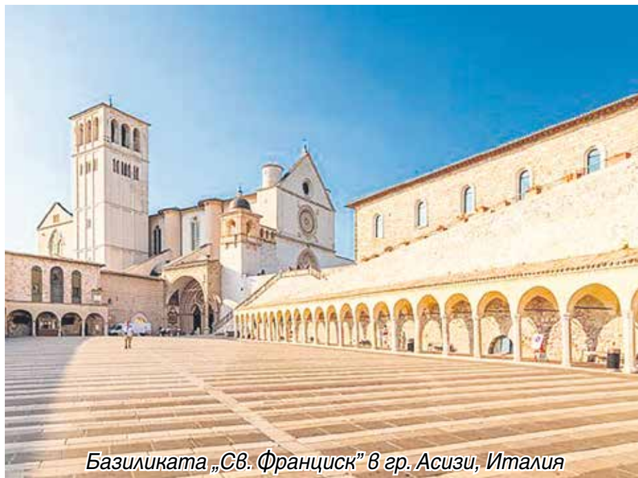
Базилката „Св. Франциск“ в гр. Асизи, Италия

Конкретни данни за патогномонични признаци и симптоми на сифилис при Свети Франциск също няма. Информацията в тази посока е оскъдна и некатегорична. И все пак, нямаме друг избор, освен да анализираме тази симптоматика, доколкото и каквато тя е стигнала до нас.