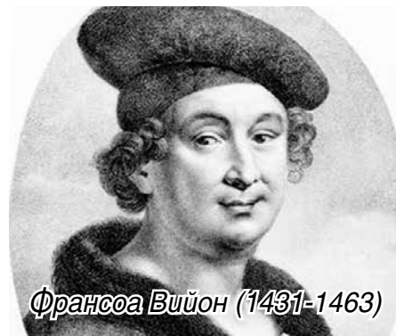
Франсоа Вийон (1431-1463)

Случаят в древността с апостол Павел е под въпрос, защото този бивш гонител на християните писал (през I век сл. Хр.): „Аз нося раните на Господа Исуса върху моето тяло“. Думите му могат да се тълкуват обаче, и изглежда тряб-