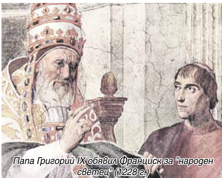
Папа Григорий IX обявил Франциск за „народен светец“ (1228 г.)

Този текст представлява около 50% от целия оригинален ръкопис, който ще бъде публикуван през 2020 година в том III от поредицата „Здравето на безсмъртните“.