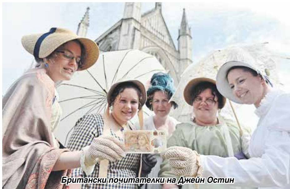
Британски почитателки на Джейн Остин