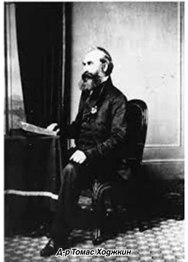
Д-р Томас Ходжкин

Защо ги обособявам отделно? Защото в тяхна подкрепа и сега има много симптоми и други доказателства, които при евентуална ексхумация (която ако не днес, то след 100 или след 200 години