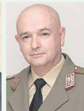
Ген. Венцислав Мутафчийски