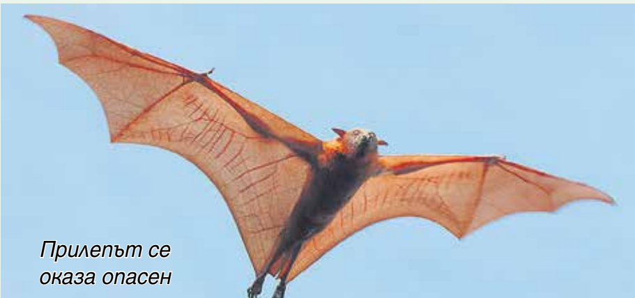
Прилепът се оказва опасен