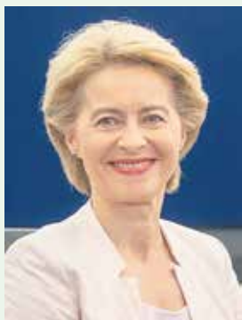
Урсула фон дер Лайен

Хаос и паника (в мътна вода най-лесно се лови тлъста риба!), безпомощ-