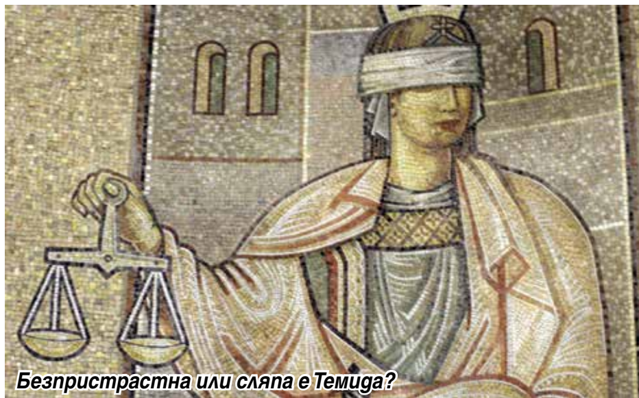
Безпристрастна или съпя е Темуга?

Удивлява ме констатацията, че от тези безспорни факти авторите не правят що-годе никакви логични анализи , не